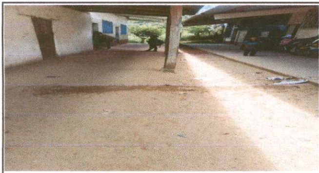
Foto 3: Instalación de 120 M2 de piso de torta de concreto de 6 cm.