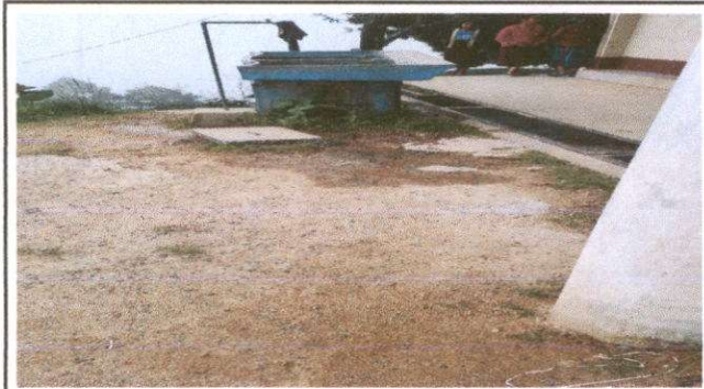
Foto1: Sustitución de tubería línea principal agua potable 20 ML.