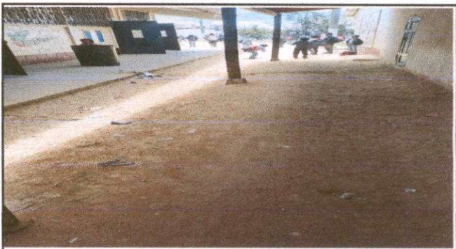
Foto 4: Instalación de 120 M2 de piso de torta de concreto de 6 cm.