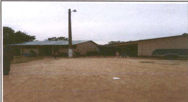
Foto 2: Instalación de 130 M2 de piso de torta de concreto de 6cm.